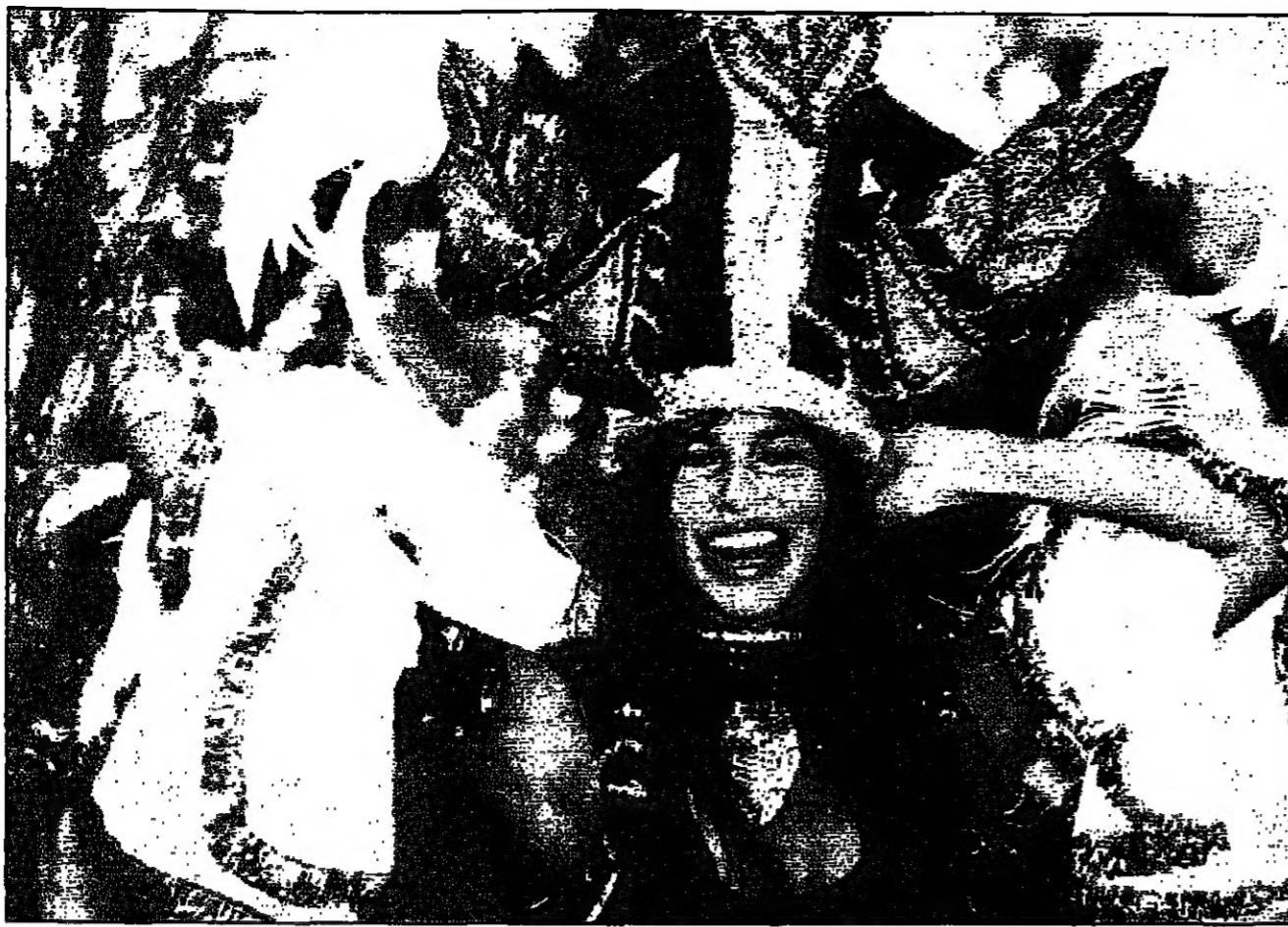
لحظة من حفل زفاف ريو دي جانيرو البرازيلي في الاستعراض الذي يقام كل عام ويضم السراويل بالهجة والرص والموسيقى والأزياء اللونة

الكويت - رويترز - نقلت صحيفة (القبس) أمس الثلاثاء ان محكمة كويتية حكمت على رجل غير كويتي بالسجن مدى الحياة لاختطافه زوجة صديقه الحبيب، واضافت ان المحكمة كانت حذرا في شهرها الثاني لدى اغتصابها شريفة التي ان القاعد الجندي عاقل عن العمل غير انها لم تحدد جنسيتها او اسمها.